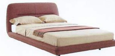
LIT TAPISSIER , avec tête de lit en acier garni de mousse polyuréthane, L 225 x l 192 x h 90 cm, design Philippe Nigro, Ultimo , à partir de 2 769 €, LIGNE ROSET.

FABRICATION FRANÇAISE. Pour un savoir-faire hexagonal avec capitonnage main et ressorts ensachés, faire appel à Treca Interiors. La marque propose un nouveau matelas Symbiose de 29 cm de confort très souple, en 3 fermetés, une face hiver avec des matières phytobioline et une face été en coton. treca-interiors-paris.com SUR MESURE ET À LA MAIN. En Italie, D'Elite fabrique des lits de très grande qualité, faits en Toscane avec des matières choisies, lin, laines vierges et cuir. À découvrir, le nouveau modèle Madame De . delitebedding.com