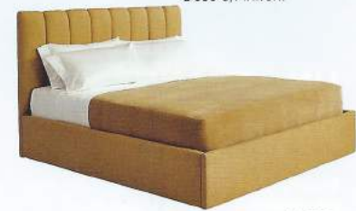
LIT ENTIÈREMENT TAPISSÉ , L 226 x l 168 x h 132 cm, Channelled Bed , 8 975 €, RALPH LAUREN HOME.