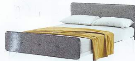
LIT EN HÊTRE , acier et polyuréthane, L 214 x l 168 x h 100 cm, design Terry Pecora, Hotelroyal , 3 336 €, ZANOTTA.