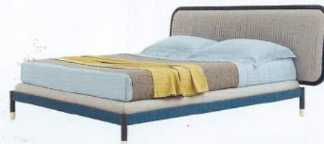
LIT EN BOIS mat ou laqué, tissu plissé et laiton, L 218 x l 176 x h 105 cm, design Cristina Celestino, Amante , 2 935 €, PIANCA.