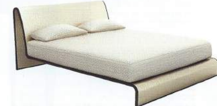
LIT « FLOTTANT » en chêne et tissu imprimé, Morfeo , prix sur demande, ARMANI/CASA.